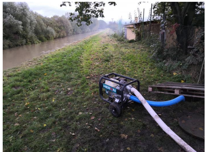
Čerpadlo pořízené obcí fungovalo po celou dobu spolehlivě, stejně jako dobrovolníci z řad občanů a hasiči, kteří zajišťovali jeho obsluhu. Díky!