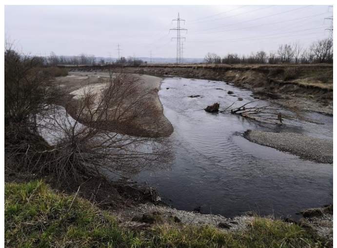
Další úniky neznámých látek úřady oznámily 27. října a 2. prosince 2020. Viníci se stále hledají.