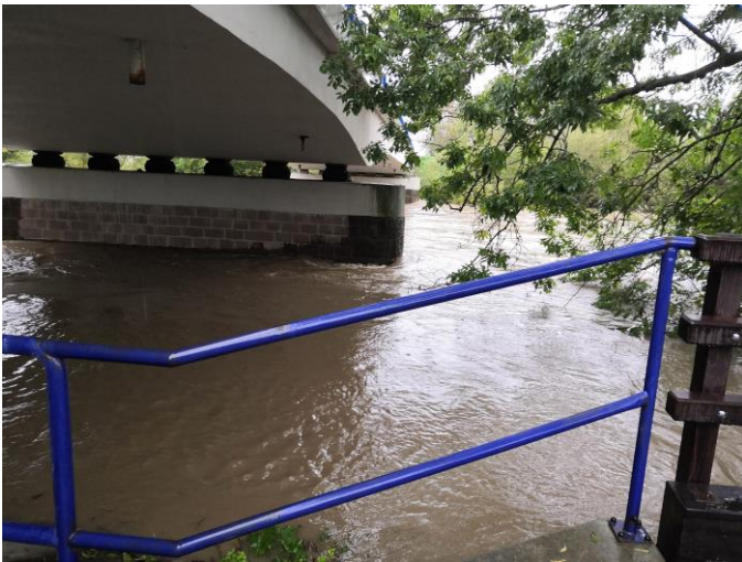
Po mírném poklesu šla znovu nahoru 14. října, kdy byla vyhlášena povodňová pohotovost.