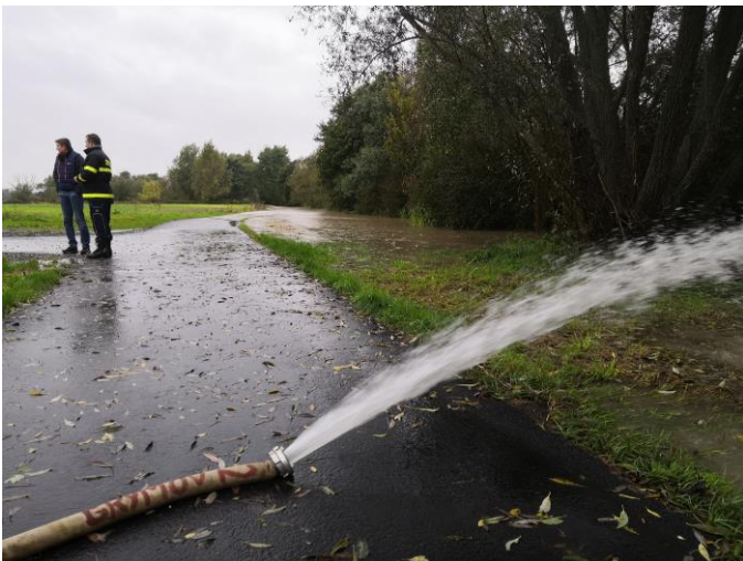
Hasiči začali odčerpávat kanalizaci a voda pomalu zaplavovala stezku pod hrází.