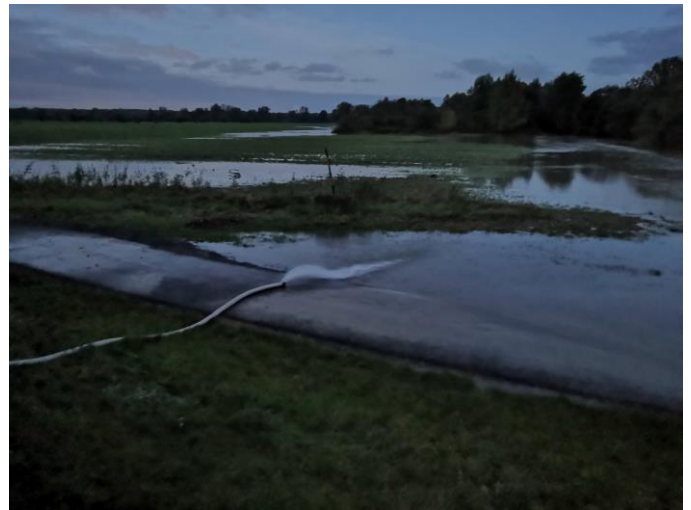
Nad ránem 15. října začala voda pomalu klesat.