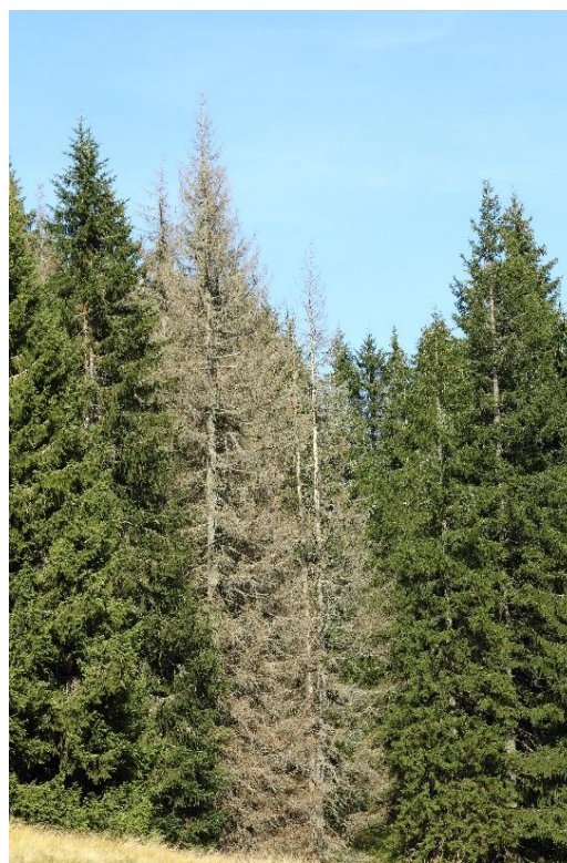
Napadenému smrku zežloutne a opadne jehličí a brzy začnou opadávat kusy kůry.

Pokud je váš strom napadený kůrovcem a vzhledem k jeho velikosti byste podle zákona k pokácení potřebovali povolení obce, můžete strom pokácet a tuto skutečnost následně na obec oznámit.