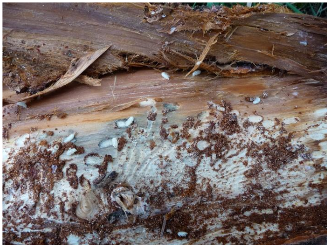
Bílé larvy kůrovce se vyvíjejí pod kůrou.

Strom se napadení snaží bránit pryskyřicí, ale pokud nemá dost vody, nemá ani pryskyřici a z vajíček se začnou vyvíjet larvy, které vyžírají lýko. Když vyříznete kousek kůry v okolí dířky, najdete pod ní bílé larvy.