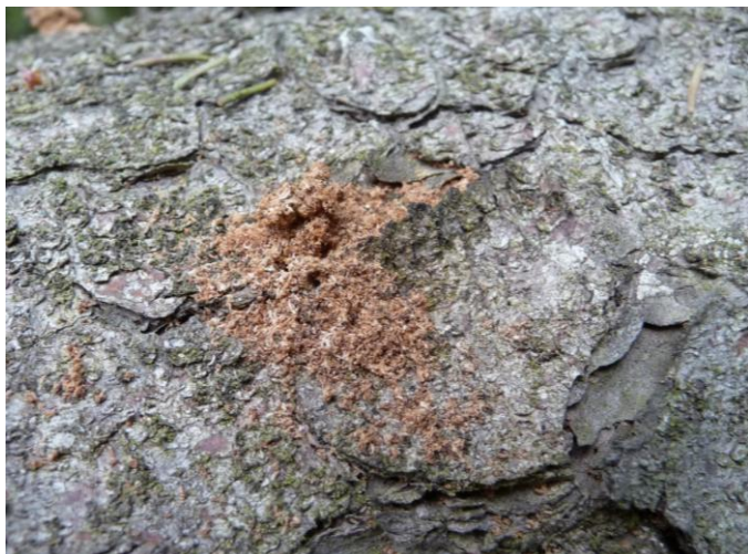
Drtinky a dířky na kůře smrku signalizují napadení kůrovcem.

Kůrovec nejdříve vyhlodá v kůře stromu díрку a do ní naklade vajíčka. Na kůře nebo u paty stromu můžete najít „drtinky“ z kůry.