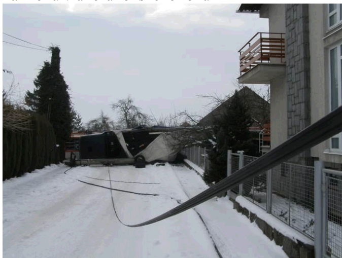
Při havárii vznikla obci škoda na veřejném osvětlení.

Obci byla po roce dohadování pojišťovnou přiznána náhrada 13 tis. Kč za škody vzniklé při havárii kamionu v únoru loňského roku