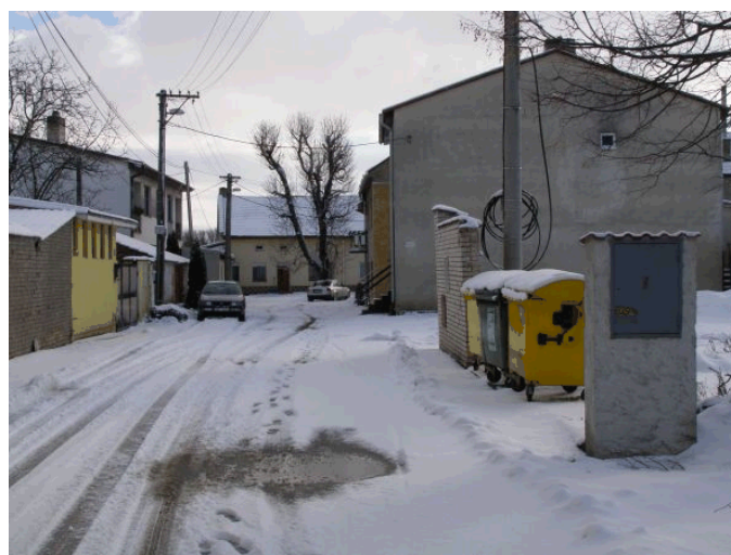
Přibude ke žlutému a zelenému kontejneru ještě modrý na papír?

Starostka obce informovala, že ve věci přidělení kompostérů dosud nebylo rozhodnuto.