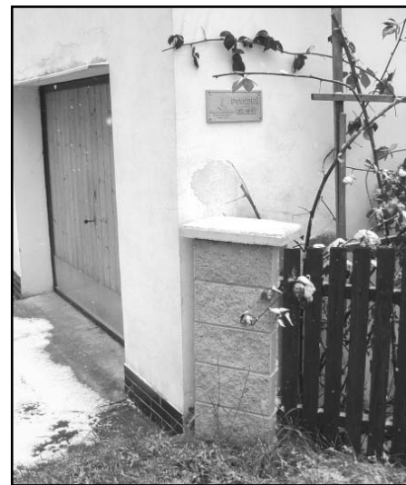
O tom, jak je dobré mít v obci hasiče, nás přesvědčila povodeň v roce 1997.

Hasiči jsou po více než půlstoletí jedním z hlavních grymovských