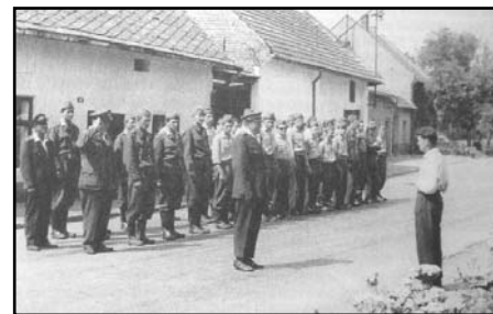
Bývaly doby, kdy grymovští hasiči měli 38 členů. Nástup po cvičení na hody 1967.

požární zbrojnicí na tzv. dětském hřišti), požárníci v následujících letech až do roku 1970 každý rok uspořádali buď ples nebo hodovou zábavu (zpravidla odpolední i večerní). Hodové zábavy se konaly v Placu. Slavné byly hlavně zábavy v letech 1966 a 67, kdy hudba hrála až do 8. hodin do rána a zábavy se zúčastnilo na 120 hodovníků!