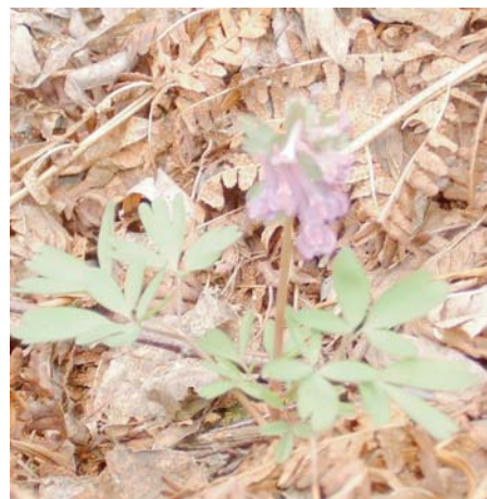
K posílům jara u nás patří i dymnivky