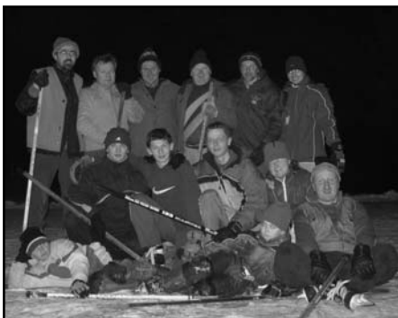
Grymovská Sazka aréna byla 11. února svědkem souboje mladší a starší gardy. Hrál se na mnoho třetin a konečné skóre zápasu světové agentury nevydaly. Ale stálo to za to!