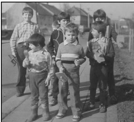
Velikonoční klepání má v Grymově dlouhou tradici. Dnes nabízíme jednu starší skupinku klepačů. Poznáte je?

aneb nezvratné důkazy o tom, že se v Grymově děje spousta věcí!