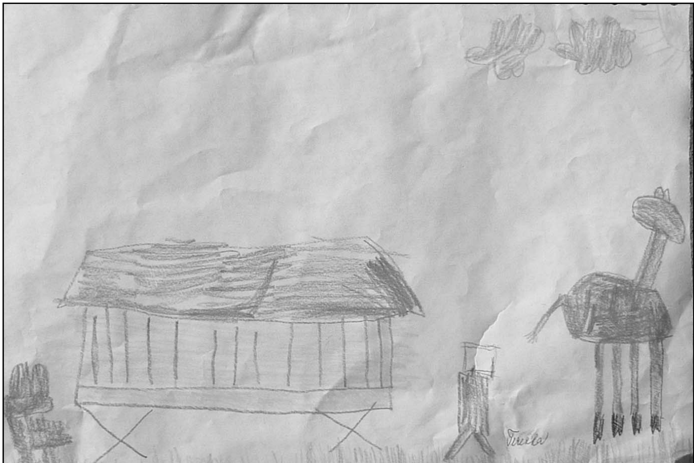
Tereza Ptáčková, 5 let