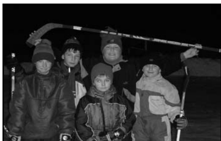
Budoucí střelci, hasiči, nebo něco jiného?